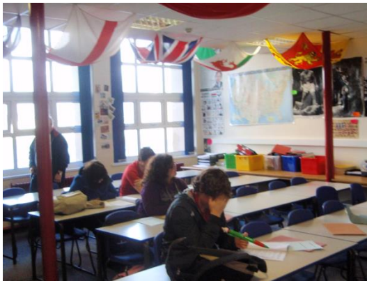
Lluniau – cyn i'r gwaith gael ei gwblhau

Cwblhawyd y gwaith ar Ganolfan Iaith Tregaron ddiwedd mis Mawrth 2016 o fewn yr amserlen ac o fewn y gyllideb. Mae'r Ganolfan wedi ei lleoli ar Gampws Ysgol Uwchradd Tregaron, sydd yn y broses o gael ei datblygu i fod yn Ysgol 3-16 oed. Derbyniwyd grant o £150,000 wrth Lywodraeth Cymru ar gyfer adnewyddu dwy ystafell yn yr ysgol yn Ganolfan Iaith, a chreu mynedfa fel y gellid cloi'r adnodd o weddill yr ysgol ar gyfer defnydd cymunedol, tu allan i oriau ysgol; gyda'r Awdurdod Lleol yn ariannu'r gweddill. Agorwyd y Ganolfan yn ystod tymor yr haf 2016, felly mae yn ei dyddiau cynnar o fodolaeth.