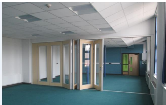
Lluniau – y Ganolfan iaith wedi i'r gwaith gael ei gwblhau