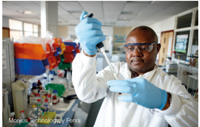
Morvus Technology, y Fenni

Mae gan ein cyrff hyfforddi ym maes iechyd gysylltiadau rhyngwladol sefydlog ledled y byd. Mae'r traddodiad cryf o waith amlddisgyblaeth rhwng GIG Cymru, prifysgolion a diwydiannau Cymru wedi esgor ar ymchwil sydd gyda'r gorau yn y byd. Yn Ewrop, llwyddwyd i sefydlu enw da Cymru drwy gyfrwng mentrau ynghylch heneiddio'n iach a'n gwaith ym maes iechyd meddwl.