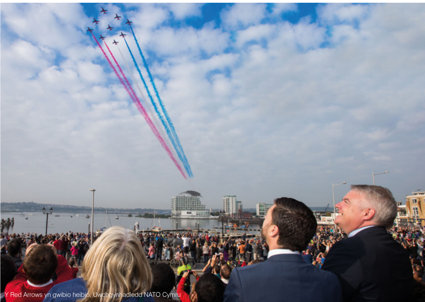
Y Red Arrows yn gwibio heibio, Uwchgynhadledd NATO Cymru