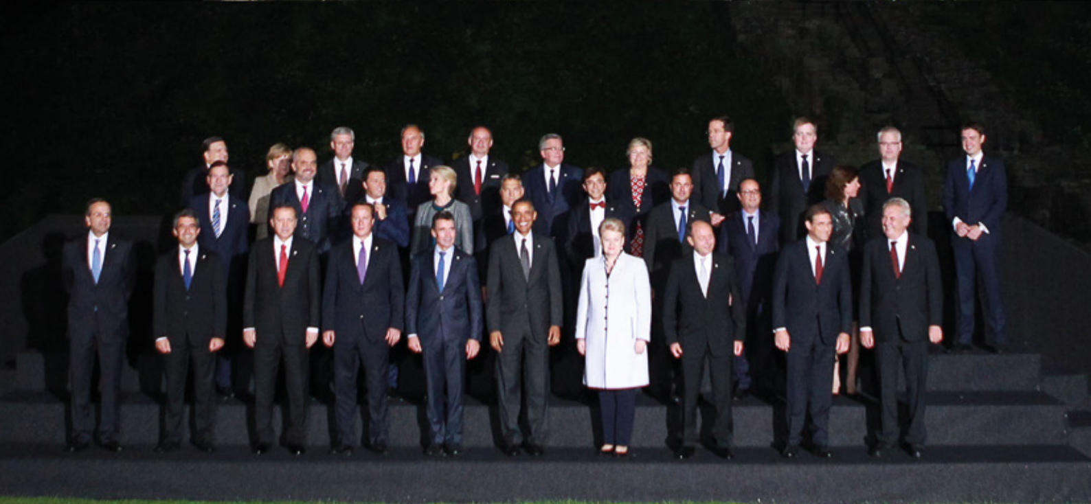
Arweinwyr NATO yn ymgasglu o flaen Castell Caerdydd ar gyfer Uwchgynhadledd NATO Cymru