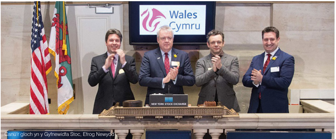
Canu'r gloch yn y Gyfnewidfa Stoc, Efrog Newydd

yng Nghymru wrth i ranbarthau'r Dwyrain Canol a Goledd Affrica fuddsoddi rhagor mewn prosiectau mawr dramor. Yn yr un modd, mae'r rhanbarthau hyn – a'u ffyniant cynyddol – yn cynnig marchnadoedd newydd, o bosibl, i allforion Cymru.