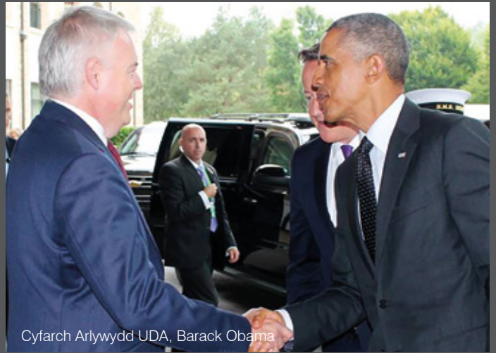
Cyfarch Arlywydd UDA, Barack Obama