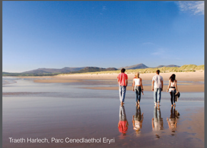
Traeth Harlech, Parc Cenedlaethol Eryri