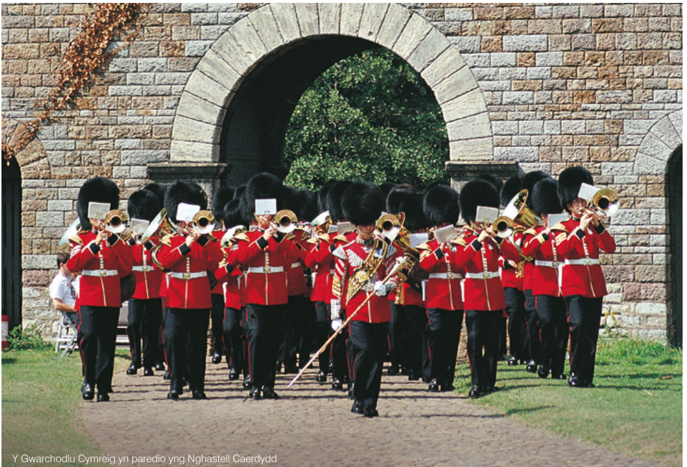
Y Gwarchodlu Cymreig yn parodio yng Nghastell Caerdydd

Mae angen inni fynd ati'n ofalus i benderfynu sut i ddyrannu'n hadnoddau a chryfhau'n ôl troed yn y byd. Mae'n rhaid inni benderfynu ar flaenoriaethau penodol a chllir.