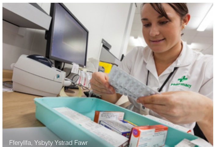
Fferyllfa, Ysbyty Ystrad Fawr