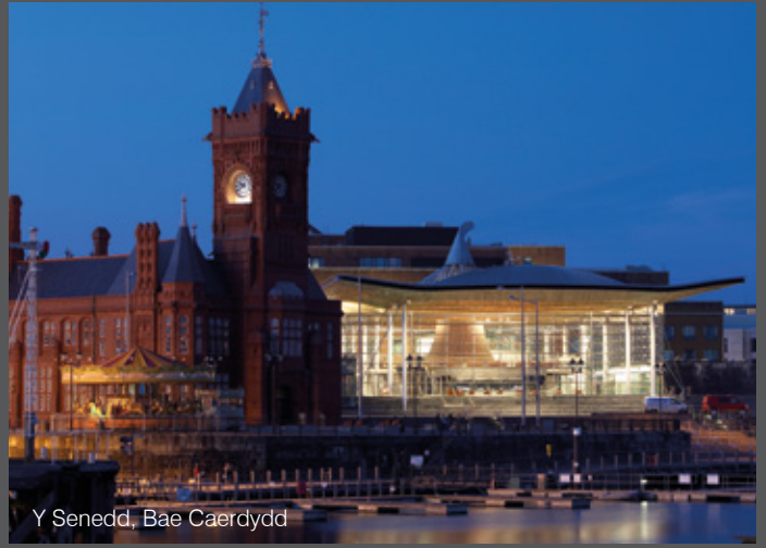
Y Senedd, Bae Caerdydd