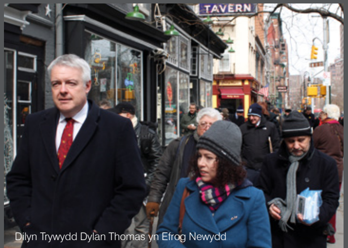
Dilyn Trywydd Dylan Thomas yn Efrog Newydd