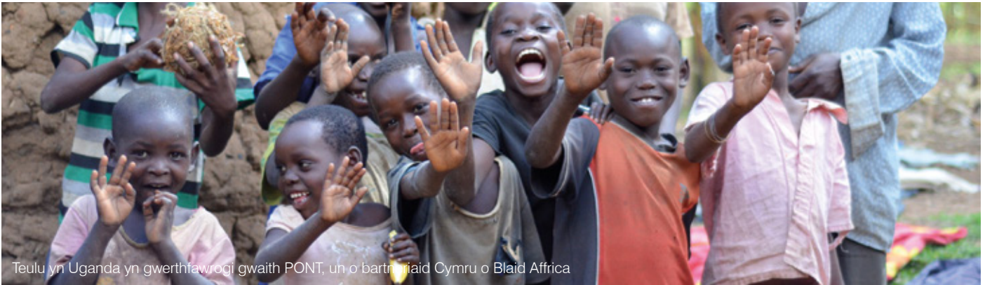
Teulu yn Uganda yn gwerthfawrogi gwaith PONT, un o bartneriaid Cymru o Blaid Affrica