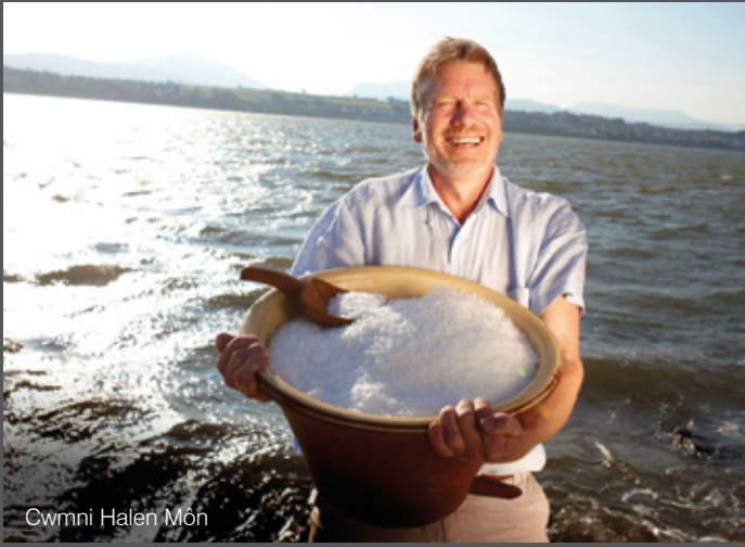
Cwmni Halen Môn