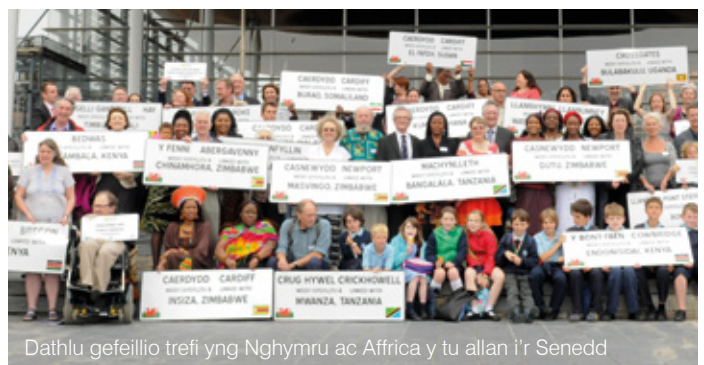
Dathlu gefeillio trefi yng Nghymru ac Affrica y tu allan i'r Senedd