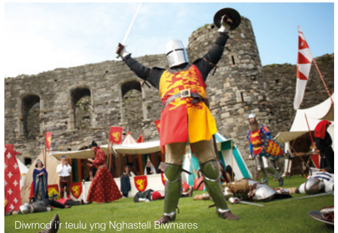
Diwrnod i'r teulu yng Nghastell Biwmares