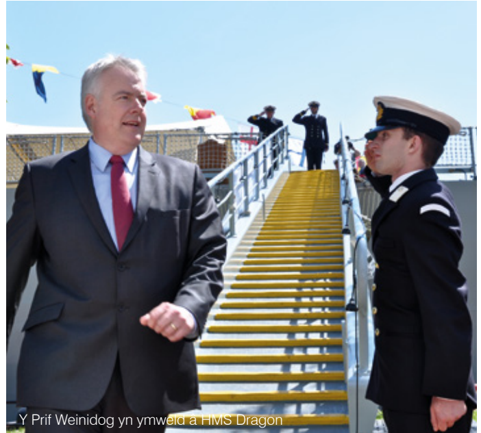
Y Prif Weinidog yn ymweld a HMS Dragon