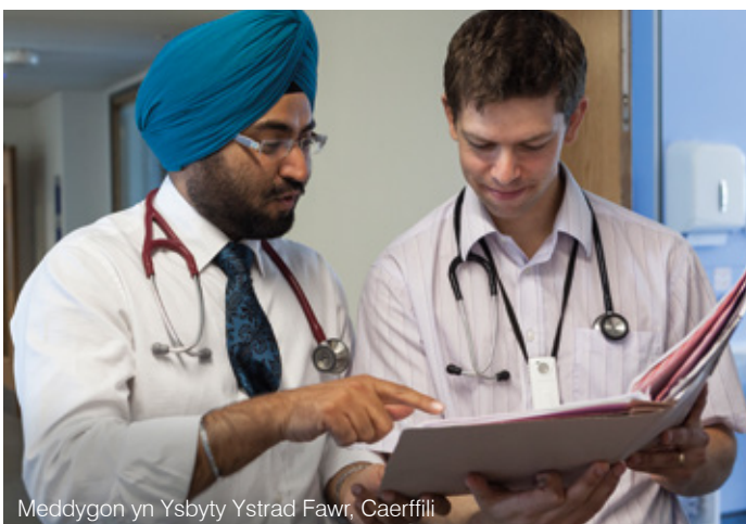
Meddygon yn Ysbyty Ystrad Fawr, Caerffili

Byddwn yn ceisio defnyddio 'Siarter Partneriaethau Iechyd Rhyngwladol' Cymru i atgyfnerthu arfer gorau yn ein gwaith datblygu iechyd gyda'n partneriaid mewn rhannau eraill o'r byd.