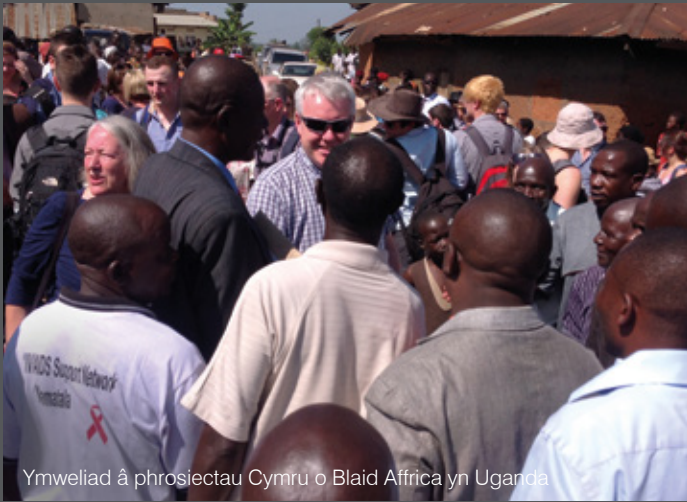
Ymweliad â phrosiectau Cymru o Blaid Affrica yn Uganda