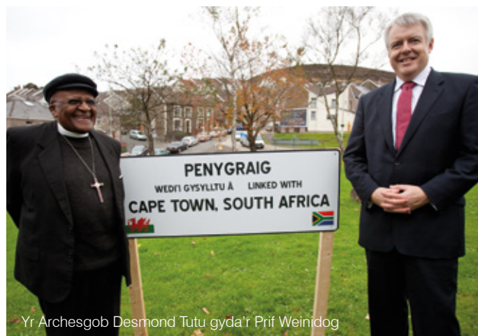
Yr Archesgob Desmond Tutu gyda'r Prif Weinidog