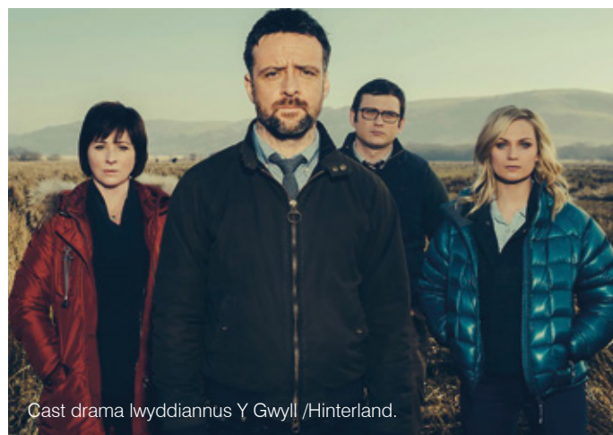
Cast drama lwyddiannus Y Gwyll /Hinterland.