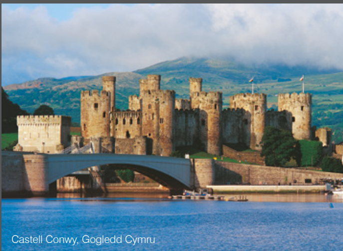
Castell Conwy, Gogledd Cymru