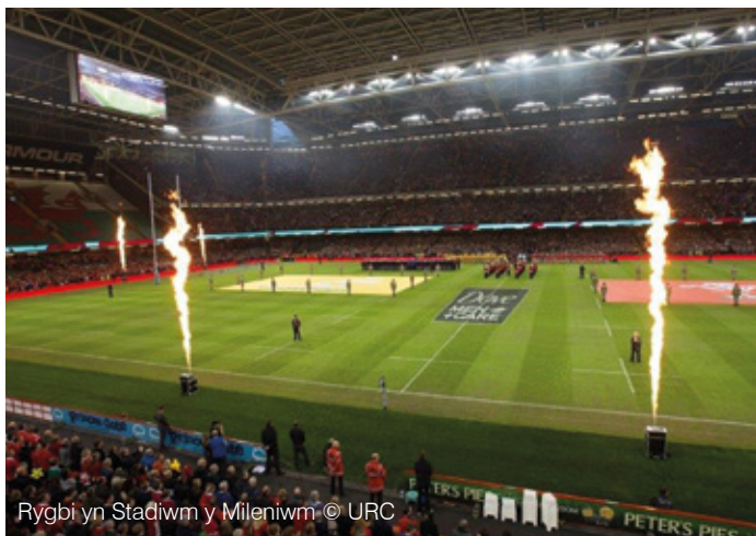
Ryggi yn Stadiwm y Mileniwm © URC