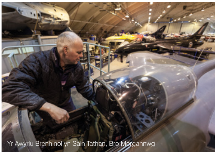
Yr Awyrlu Brenhinol yn Sain Tathan, Bro Morgannwg