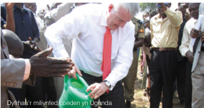
Dyfrhau'r miliynfed coeden yn Uganda

Mae'r cysylltiadau ag nrg4SD yn rhoi cyfle arall i Gymru ddylanwadu ar y Cenhedloedd Unedig ac i hyrwyddo safbwyntiau Cymru ar lwyfan rhyngwladol.