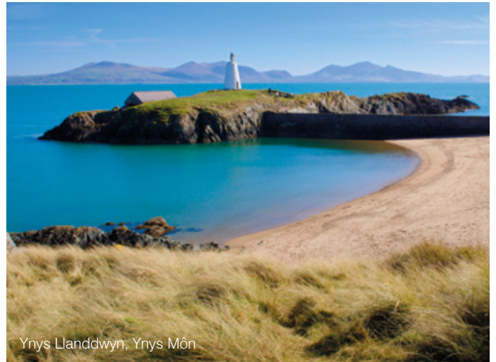
Ynys Llanddwyn, Ynys Môn

lywodraethu Cymru a byddwn yn cyfrannu'n llawn at benderfyniadau sy'n effeithio ar ein buddiannau. Mae rhaglenni cyllido Ewropeaidd yn helpu i gynnal datblygiad economaidd Cymru a byddwn hefyd yn cydweithredu â'n cymdogion at y diben hwn drwy raglen INTERREG. Yn yr un modd, rydym yn ceisio ymgysylltu â chyrff rhyngwladol i hyrwyddo safbwyntiau Cymru mewn meysydd polisi allweddol fel datblygu cynaliadwy a'r newid yn yr hinsawdd.