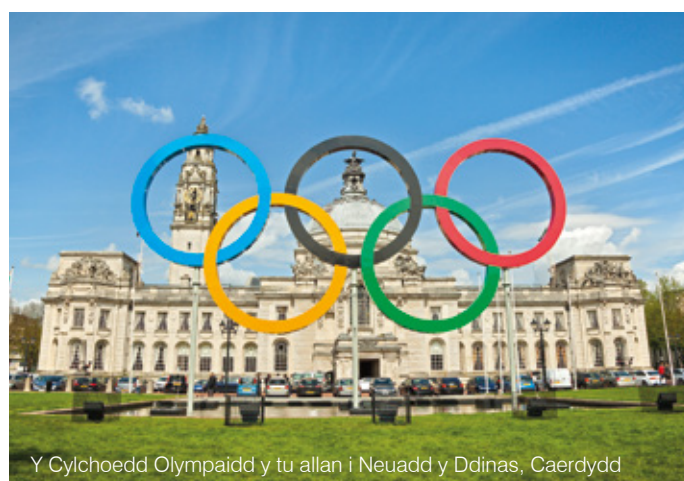
Y Cyloedd Olympaidd y tu allan i Neuadd y Ddinas, Caerdydd