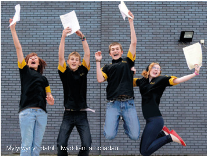
Myfyrwyr yn dathlu llwyddiant arholiadau