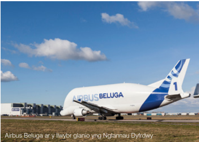
Airbus Beluga ar y llwybr glanio yng Nglannau Dyfrdwy

cwmnïau eraill sydd wedi hen sefydlu yma i ail-fuddsoddi gan gynnwys Sony, GE Healthcare, EE, Airbus a Convatec, a llwyddwyd i sicrhau buddsoddiadau newydd gan gwmnïau fel Clickbond, AIC Steel a Stiwdios Pinewood. Yn 2013-14, cafwyd 16 o fuddsoddiadau newydd yng Nghymru, ail-fuddsoddodd 53 o gwmnïau yma a chafwyd 10 o gaffaeliadau. O ganlyniad, crëwyd dros 2,800 o swyddi newydd a diogelwyd bron 8,000 o swyddi eraill. Mae ffigur 2 yn dangos y 10 ffigur mewnfuddsoddi uchaf yn ôl gwlad ar gyfer 2013-14.