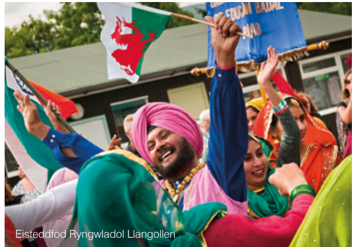
Eisteddfod Ryngwladol Llangollen