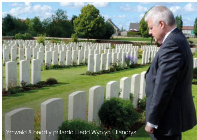
Ymweld â bedd y prifardd Hedd Wyn yn Fflandrys