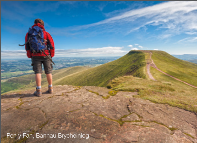
Pen y Fan, Bannau Brycheiniog