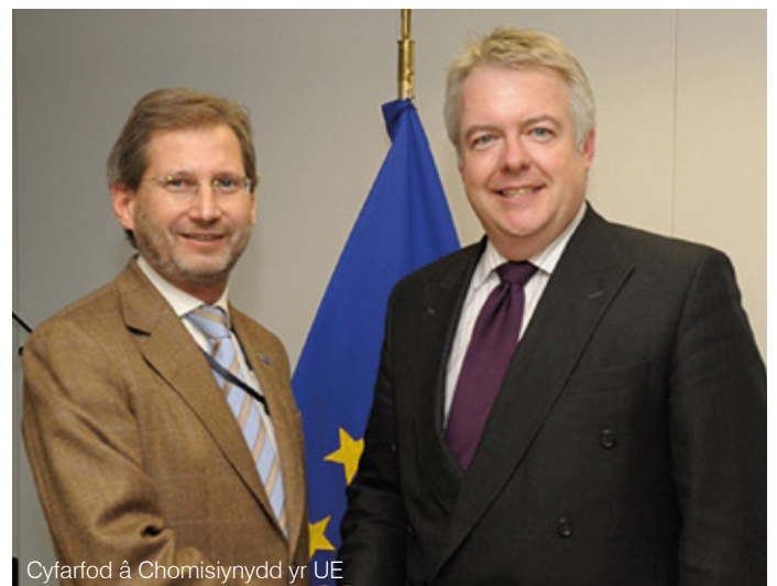
Cyfarfod â Chomisïynydd yr UE

Mae Swyddfa Cyllid Ewropeaidd Cymru yn ymgysylltu'n uniongyrchol â'r Comisiwn Ewropeaidd wrth gyd-drafod, gweithredu a chyflenwi Rhaglenni Cronfeydd Strwythurol yr UE yng Nghymru, materion Polisi Cydlyniant ehangach a rhaglenni y bydd yr UE yn eu rheoli'n uniongyrchol fel Horizon 2020.