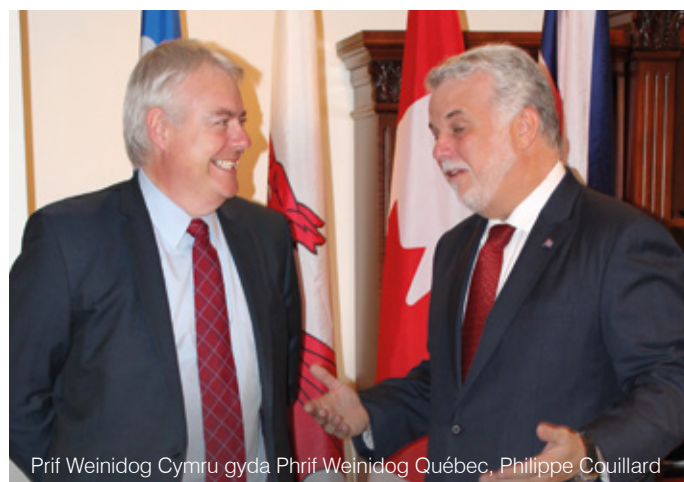
Prif Weinidog Cymru gyda Phrif Weinidog Québec, Philippe Couillard

Mae'r Cymry ar Wasgar drwy'r byd, cymdeithasau Cymreig a chyn-fyfyrwyr Prifysgolion Cymru i gyd yn cynnig cyfleoedd amrywiol i hyrwyddo buddiannau'r genedl.