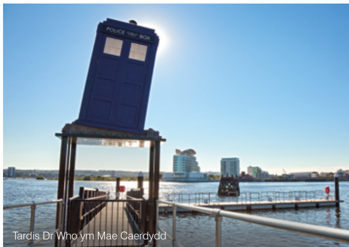
Tardis Dr Who ym Mae Caerdydd