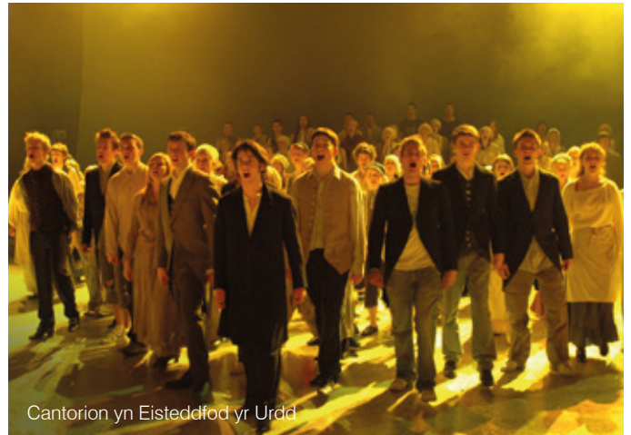
Cantorion yn Eisteddfod yr Urdd

Byddwn yn ceisio adeiladu ar ein hasedau unigryw i sicrhau cynnydd o 10%, mewn termau real, yn yr enillion a gynhyrchir drwy dwristiaeth erbyn 2020, gan ganolbwyntio fwyfwy ar hybu gweithgareddau marchnata rhyngwladol, i gynyddu gwerth ymwelwyr tramor i Gymru.