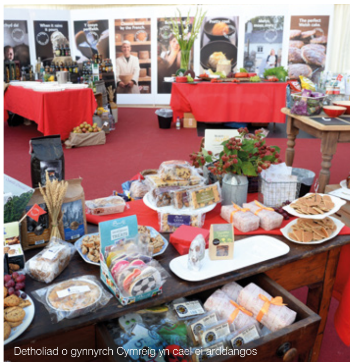
Detholiad o gynnyrch Cymreig yn cael ei arddangos

Yn 2013-14 llwyddwyd i sicrhau mewnfuddsoddiad gan 79 o gwmnïau, sef y nifer fwyaf ers 30 o flynyddoedd. Penderfynodd